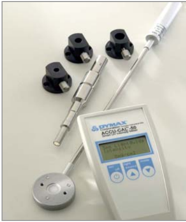
Radiomètre ACCU-CAL™ 50 Mesure de l'intensité en UVA des équipements Spot, de Projection et des convoyeurs Référence 39560