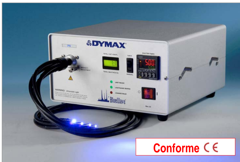
BlueWave 75 UV- Lampe Spot pour réticulation UV, ajustement d'intensité et guide lumière quatre brins

En émettant en UVA et lumière bleue visible (300 à 450nm), la lampe Spot BlueWave 75 a été développée pour la polymérisation des adhésifs, revêtements ou autres encapsulants, à réticulation UV/VIS. Le rideau intégré, commandé par un interrupteur à pied ou par asservissement, est parfaitement adapté aux modes de fabrication manuel ou automatique. Un transformateur autorégulé, permet les meilleures performances, quelque soit le signal d'entrée (90-264V, 47-63 Hz). DYMAX propose également une gamme complète de guides lumière, robustes à cristaux liquides ou à fibres optiques, en mono ou multi brins, disponibles dans plusieurs longueurs. La BlueWave 75 avec son ajustement d'intensité, est la plus polyvalente, la plus facile d'utilisation, et la plus fiable des unités pour réticulation par points, proposées sur le marché.