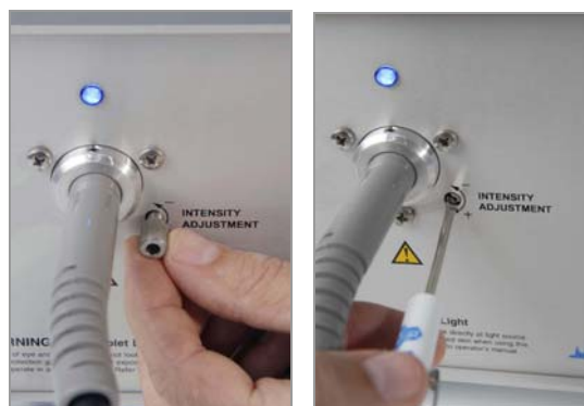
Ajustement à l'aide du bouton