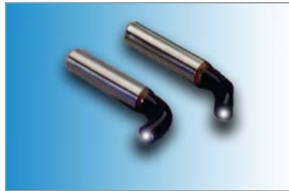
Report d'angle pour Guide Lumière 3 mm/60° Réf 39029 ■ 3 mm/90° Réf 39030 5 mm/60° Réf 38042 ■ 5 mm/90° Réf 38049