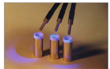
Faisceau à trois brins pour réticulation lors d'un assemblage métal - plastique

1 Mesuré le radiomètre DYMAX ACCU-CAL™ 50 (320-395 nm)). Des allumages et extinctions intempestifs, ou un refroidissement inadapté, peuvent agir sur la dégradation de l'ampoule : dans ces cas, la garantie n'est plus assurée ou applicable.