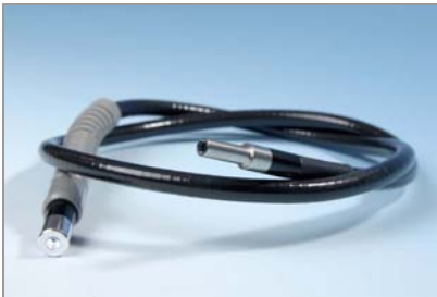
Guide lumière à cristaux liquides proposés en 1, 2, 3 ou 4 brins (se reporter au tableau 1 pour les dimensions et les références)