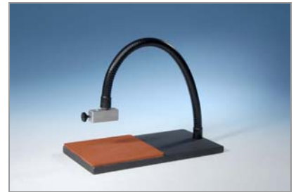
Support de montage pour guide lumière (pour guide lumière \Phi 3 mm, 5 mm et 8 mm) Réf : 39700