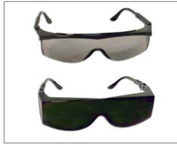
Lunettes de Protection Grise Réf. 35285 Verte Réf : 9162044